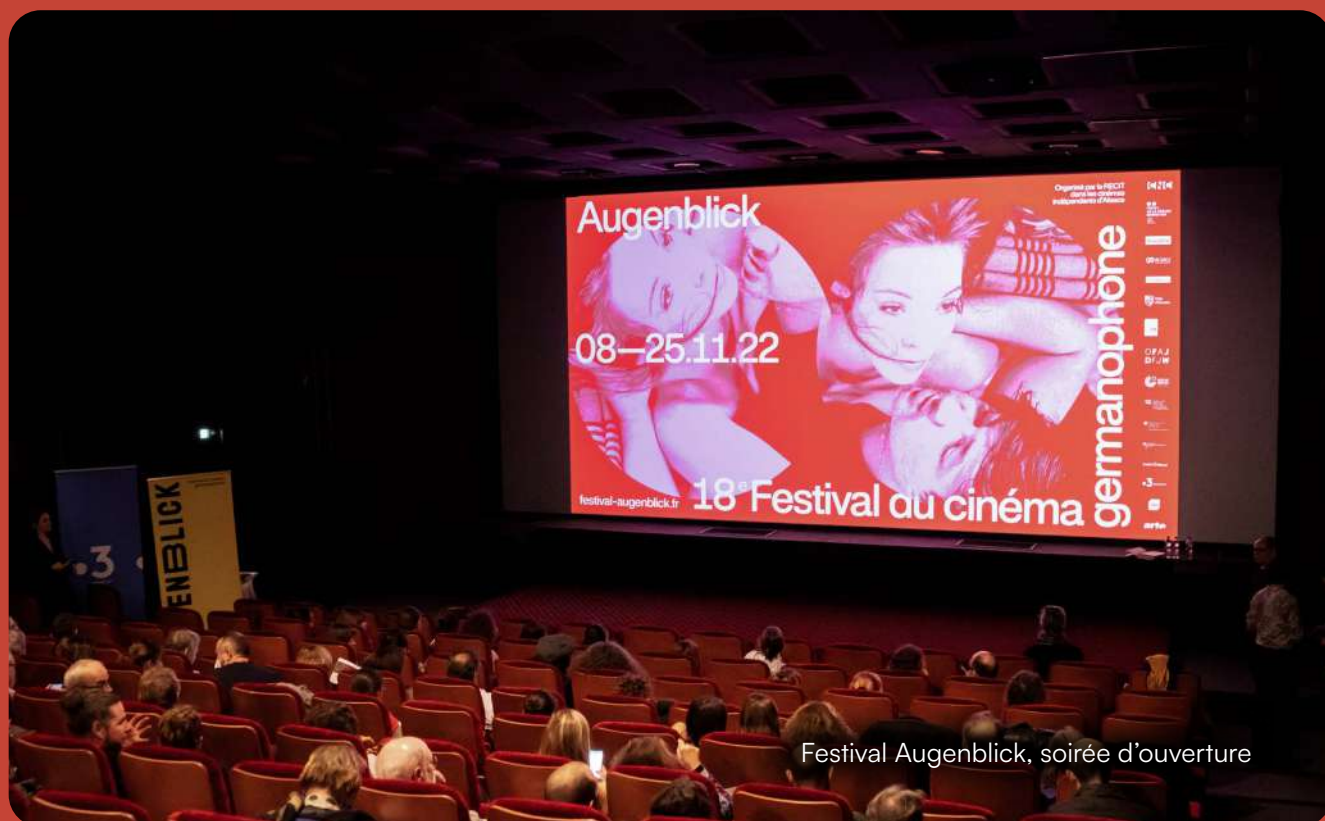
Festival Augenblick, soirée d'ouverture

Le Festival se donne comme objectifs la découverte de la culture et de la langue des pays voisins germanophones par le regard de leurs cinéastes et de rendre compte de la diversité de la production cinématographique germanophone à travers une programmation large et éclectique : sont programmés les films de réalisateurs confirmés, reconnus du public en France et dans le monde (W. Herzog, V. Schlöndorff, M. Von Trotta, F. Akin), des œuvres « grand public » ayant rencontré le succès au box-office allemand, des films jeunesse, des documentaires, courts métrages et films de répertoire. Le Festival met également un point d'honneur à diffuser les productions de la nouvelle génération de cinéastes.