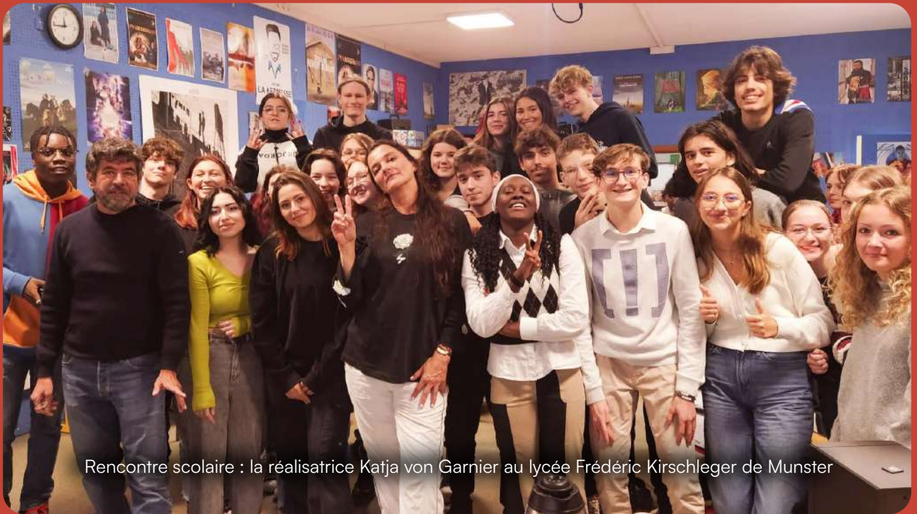
Rencontre scolaire : la réalisatrice Katja von Garnier au lycée Frédéric Kirschleger de Munster

Chaque année, plus de 65 000 spectateurs sont au rendez-vous d'AUGENBLICK qui garde pour objectif de toujours susciter, entretenir et satisfaire cette curiosité pour le cinéma germanophone et la langue allemande.